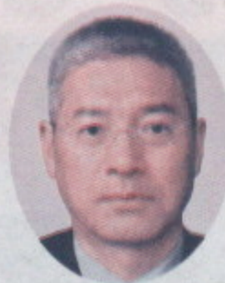
金沢市町会連合会

次に私の町会は、新堅町三丁目会で商店街も形成しています。一時の賑わいがなく、寂しくなってきましたが、各店舗がそれぞれの個性をだしてちょっとレトロな商店街です。8月の「ふれ愛まつり」や10月の「コーヒー大作戦」のイベントも3年ぶりに開催し、大いに賑わいました。町会長と商店街の会長は、兼職のため商店街活動も町会の仕事に入ります。手芸と雑貨のお店のオーナー女性から「会長もインスタやって、商店街をPRして」といわれ、手ほどきを受けてインスタに挙げました。商店街のことを載せると、彼女は、商店街のHPに載せます。ただ、どちらかと